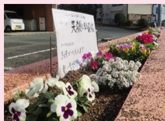
テーマ② 笑顔になる花壇