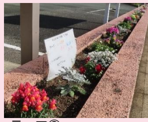
テーマ③ ちょうちょうが集まる花壇