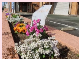
テーマ① 心はずみ 春色の風を感じる花壇